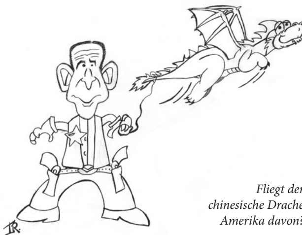
Fliegt der chinesische Drache Amerika davon?

Menschen in Europa um ihren Arbeitsplatz. Und wenn Massenarbeitslosigkeit droht, sind Spannungen bekanntlicherweise nicht mehr fern. Misstrauisch und besorgniserregt betrachten insbesondere die Amerikaner den militärischen Aufschwung des „strategischen Wettbewerbers“, wie Präsident Bush die Volksrepublik nennt. Auch wenn die eigenen Militärausgaben (453,6 Mrd. Dollar 2004) noch weit über den chinesischen (55,9 Mrd. Dollar 2003) liegen, ist die chinesische Armee in der Anzahl ihrer Soldaten weit überlegen. Unter Einberechnung verdeckter Zahlungen mit offiziell anderem Verwendungszweck rechnet das