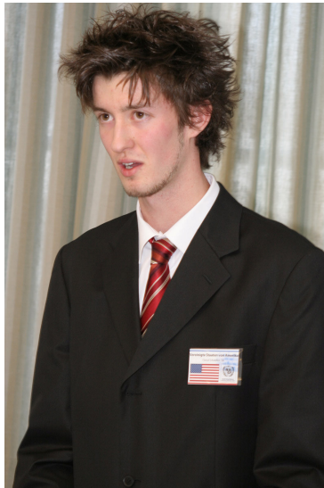
David Schindler, der US-Delegierte im Sicherheitsrat, hatte erneut mit schweren Anschuldigungen zu kämpfen.

In seiner Ansprache betonte er zunehmende separatistische Bewegungen, die gegen die Staatsordnung und damit jegliche Friedensversuche in Zentralafrika vorgehen. Des Weiteren verurteilte er die Vorgehensweise der USA, welche ein „Geschwür im Sudan“ darstelle. Er warf den Vereinigten Staaten von Amerika vor, den Terrorismus im Land aktiv zu unterstützen und