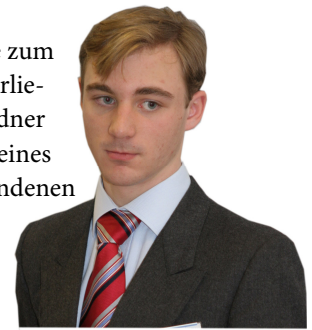
Der slowenische Delegierte Hendrik Schmidt zeigte sich „enttäuscht“, dass der Sudan die UN zurückwies.

Der Delegierte der USA wies alle Schuldanweisungen zurück, insbesondere die Unterstützung des Terrorismus und wies darauf hin, dass sie sich auf die Entgegenwirkung einer humanitären Krise konzentrieren. Die Slowakei ist erstaunt, dass eine Unterstützung der Region durch UN-Friedenstruppen vorerst für nicht notwendig erachtet wird, so werde doch immerhin der weltweite Wille zum Frieden dadurch Ausdruck verliehen. Der sudanesischer Gastredner verwies auf die Souveränität seines Landes und dem damit verbundenen Recht zur alleinigen Lösung des Problems.